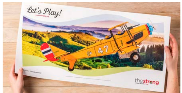
Impression sur feuille extra longue - dimensions de papier maximales 330 x 660 mm

Cet outil permet d'obtenir de meilleures marges, des profits plus généreux, et la possibilité de vous développer stratégiquement grâce à un investissement d'avenir simple.