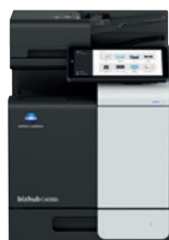
bizhub i-Series C4050i

Ainsi, à mesure que votre entreprise grandira, nous grandirons avec vous, en reliant les personnes et les lieux, pour donner une nouvelle dimension à la gestion des flux de documents et de la sécurité.