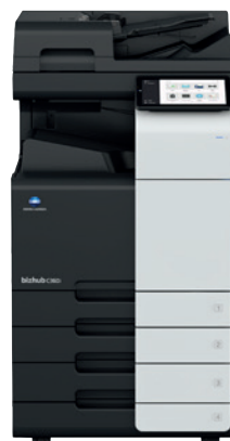
bizhub i-Series C360i